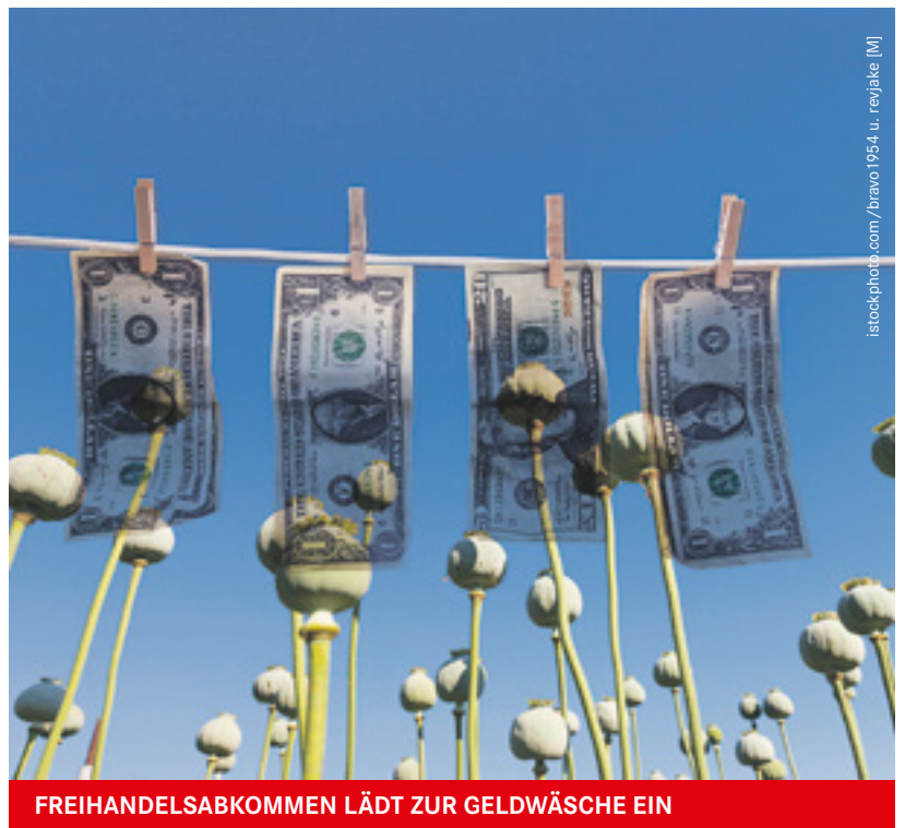
FREIHANDELSABKOMMEN LÄDT ZUR GELDWÄSCHE EIN

massive Spekulation auf den Nahrungsmittelmärkten eingeschränkt werden soll, und es ist recht wahrscheinlich, dass sie in nächster Zeit in der EU eingeführt werden. Ähnliches droht bei einer Bankentrennung in der EU: Zur Trennung von Geschäfts- und Investmentbanken laufen derzeit erste Verhandlungen,