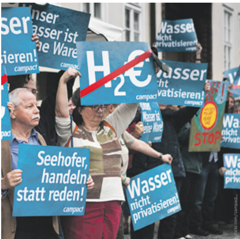
DIE PROTESTAKTIONEN VON BÜRGERINNEN WAREN ERFOLGREICH